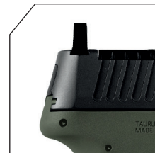
Miras altas CO WITNESS