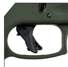
Gatilho de 3º geração